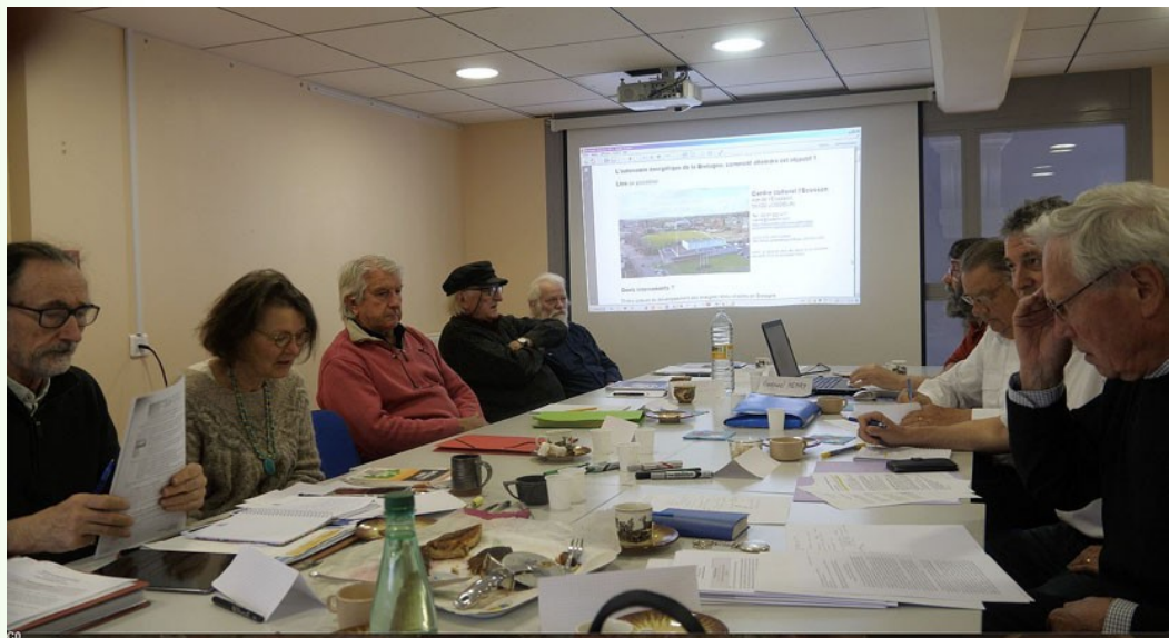
réunion de travail de Bretagne majeure à Kemper 22 a viz meurzh 2023

Prochaine conférence : "les finances publiques en Bretagne" Club de la Presse de Bretagne (Janvier 2024)